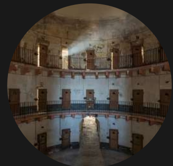
FRACASO DEL SISTEMA PENITENCIARIO