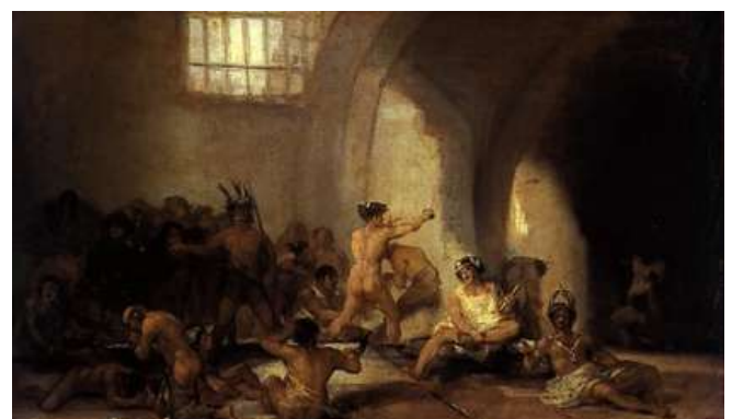
«Casa de locos» de Francisco Goya 1812-1819