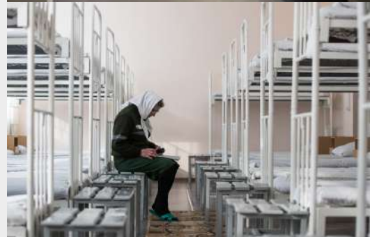
Noruega y Rusia