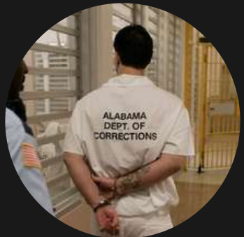
COMPARATIVA DE OTROS SISTEMAS PENITENCIARIOS