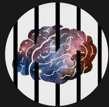
CONSTRUCTO DE LA PERSONA PSIQUIATRIADA EN PRISIÓN

Para eso el primer paso es desnaturalizar la situación de las personas privadas de libertad que sobre todo tienen problemas de salud mental y explicar el estigma que esto provoca. Una vez posicionada la situación del individuo nos dirigimos hacia el sistema penitenciario en sí comparándolo con otros sistemas de otros países yendo desde el más represivo hacia el que más se acerca a la resocialización y finalmente dar un a visión del posible fracaso del sistema penitenciario.