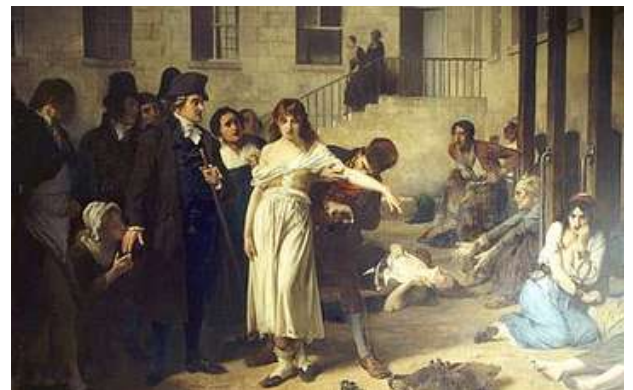
Philippe Pinel en asilo de París para "mujeres locas", Cuadro de Robert Fleury (1795).

Como mencionábamos más arriba, siguiendo el trabajo foucaultiano, es importante realizar una arqueología del saber, un desenterramiento de los cimientos y orígenes de las categorías y determinantes sociales y culturales que hoy en día damos por supuestas. Supone un ejercicio de desnaturalización de los fenómenos sociales que deseamos y debemos transformar. Para cambiar o mejorar la situación social de un colectivo es importante entender primero de donde surge, comprender qué momentos sociohistóricos han llevado a estas situaciones. Si comprendemos que todo aquello que observamos en nuestro entorno social tiene un origen concreto seremos capaces de ponerlo en duda, lo cual supone un primer momento en la intención de transformarlo, pues lo que hoy es no siempre ha sido y no tiene porqué seguir siendo así mañana.